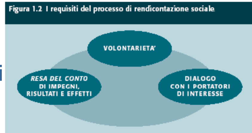
Figura 1.2 I requisiti del processo di rendicontazione sociale